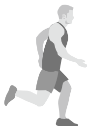
Tabella per l'assegnazione dei punti per ogni disciplina durante il reclutamento

Il test della resistenza viene svolto all'aperto su una pista di atletica oppure in palestra come corsa a pendolo su una distanza di 20 m. Per i due test non valgono le stesse tabelle di valutazione. La velocità di corsa viene scandita da un segnale acustico, come per il test di Conconi. La velocità di partenza è di 8,5 km/h. La velocità aumenta di 0,5 km/h ogni 200 m. Il tempo viene fermato quando il corridore non è più in grado di tenere il ritmo imposto.