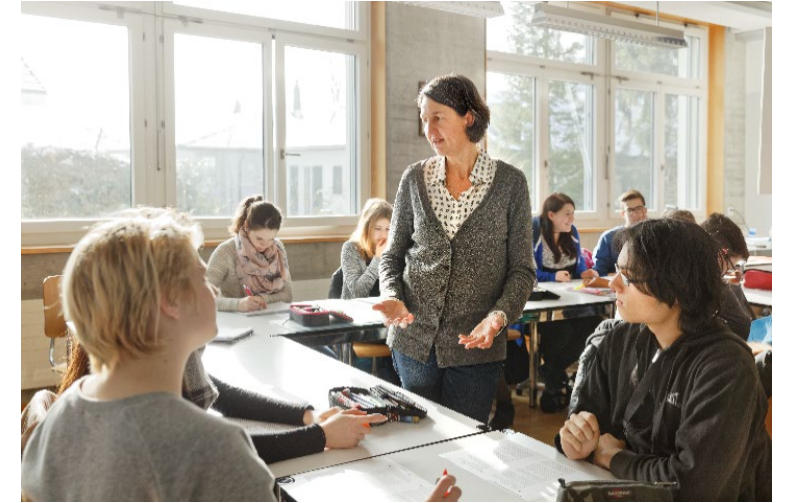
Berufsfachschulen und höhere Fachschulen