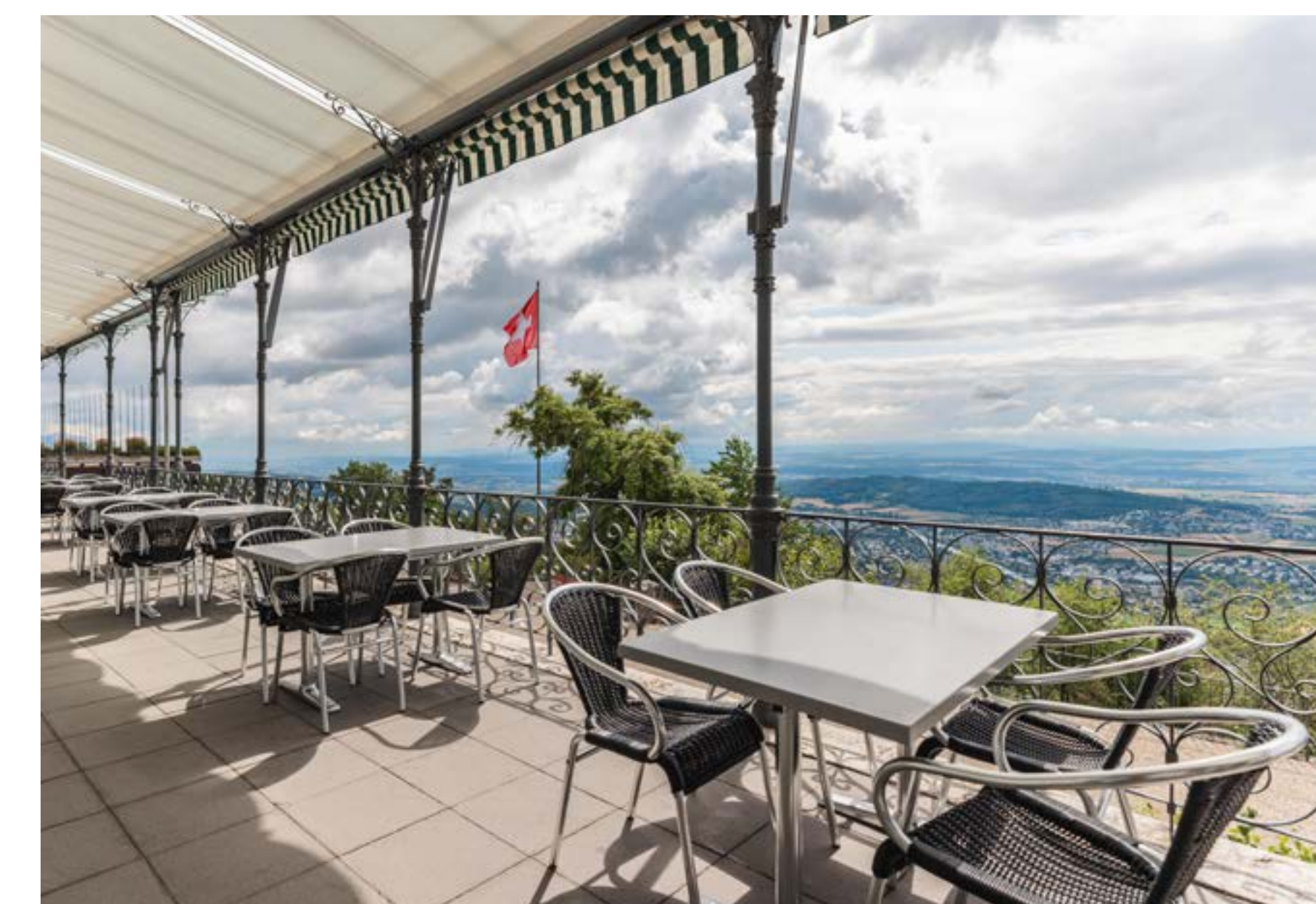
Die Restaurants End der Welt und Bellavista sowie die Cafeteria mit Terrasse des Grand Hotel stehen auch der Bevölkerung offen.