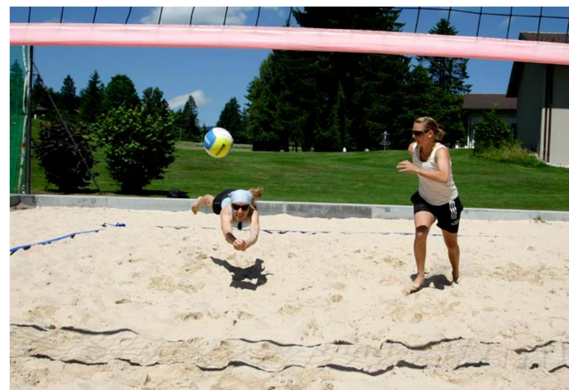
Die Beachvolleyball-Anlagen befinden sich neben der Alten Sporthalle sowie neben dem Stadion End der Welt.