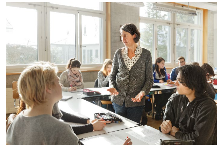
Ecoles professionnelles et écoles supérieures