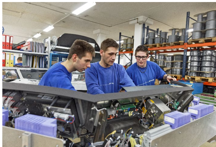
Cours interentreprises et écoles de métiers