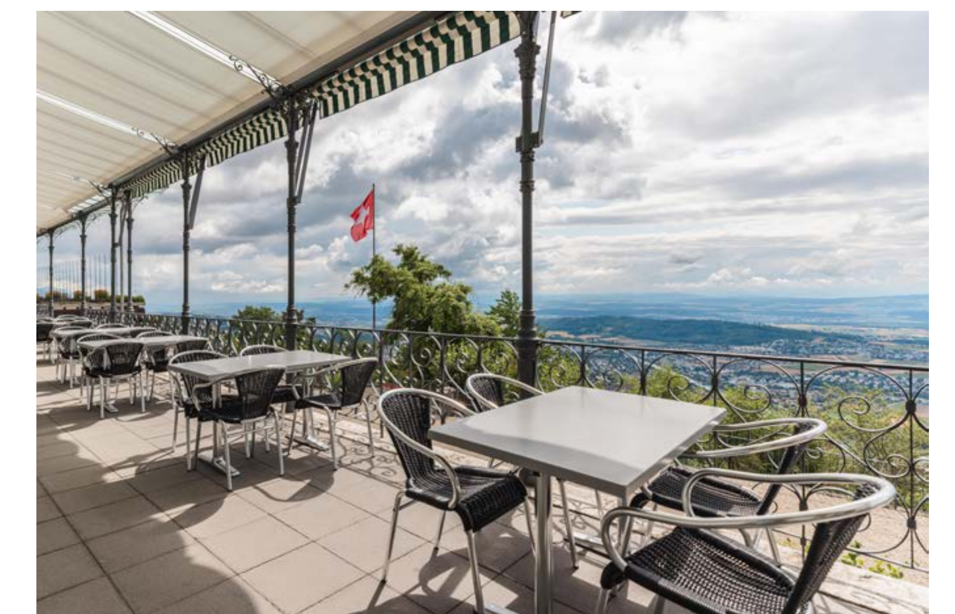
Les restaurants Fin du Monde et Bellavista, ainsi que la cafétéria avec terrasse du Grand Hôtel, sont également ouverts au public.