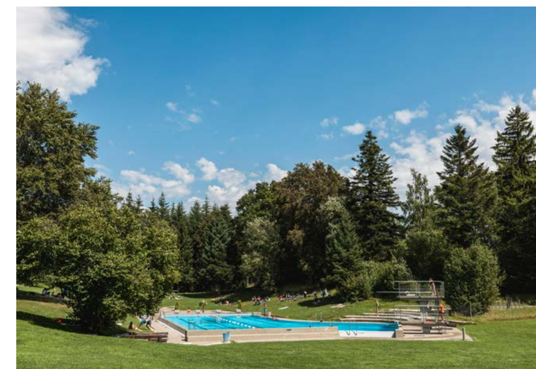
La piscine en plein air est ouverte de juin à septembre. Hors saison, la piscine couverte du bâtiment principal est disponible le mercredi soir.